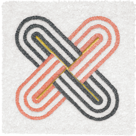
Lore Bert: Zwei mal unendlich , 2010

Bildobjekt mit Japanpapier und Blattgold, 65 x 65 cm WVZ-Nr. 10178